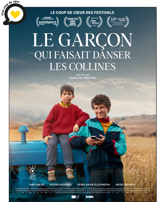
Ne pas jeter sur la voie publique.